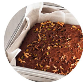
Paniertes und Blätterteig