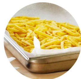
Pommes frites und Kartoffeln