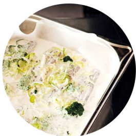
Gratins und Aufläufe