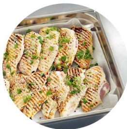
Fleisch- und Fischgerichte