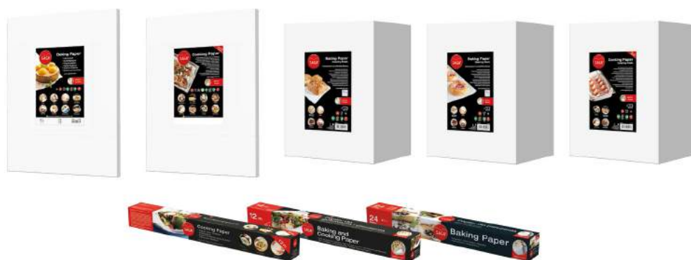
Backformen, Back- und Kochpapierbögen und Backpapierrollen

SAGA steht für qualitativ hochwertige Back- und Kochpapiere. Unser Sortiment umfasst Produkte für Verbraucher, professionelle Großküchen und Bäckereien.